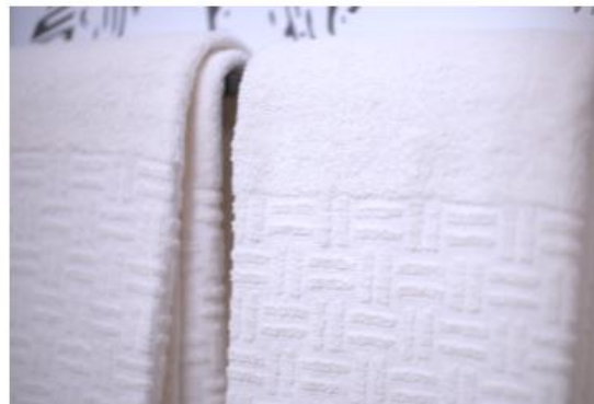
La nouvelle gamme de linge couleur naturelle

Parallèlement, AccorHotels et son partenaire industriel Standard Textile ont mis au point une technologie d'Elévation® innovante qui consiste à concentrer la masse du tissu sur le centre de la serviette de bain, ce qui permet d'optimiser le poids du produit tout en gardant la même qualité du geste et la même perception pour le client. Cette innovation, couplée à la suppression du blanchiment chimique lors de la phase ennoblissement, entraîne une diminution considérable de l'empreinte environnementale : entre 45% et 52% de diminution des impacts environnementaux pour une unité de linge éponge des marques milieu de gamme, et entre 35% et 45% pour le linge des marques économiques.