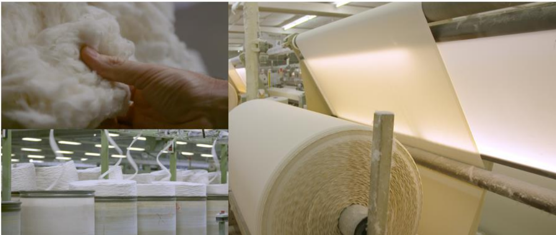
Tissage et ennoblissement du linge de lit chez Standard Textile et Tissage Mouline (Vosges)