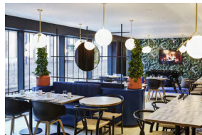
EDINBURGH ROYAL MILE ROYAUME-UNI