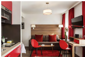
PARIS COURBEVOIE FRANCE