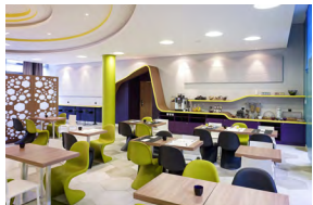
KÖLN CITY ALLEMAGNE