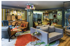
PARIS BERCY VILLAGE FRANCE