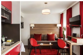
PARIS COURBEVOIE FRANCE