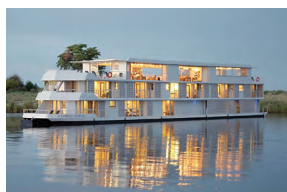
ZAMBEZI QUEEN BOTSWANA