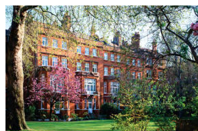
THE DRAYCOTT ROYAUME UNI