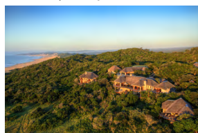
OCEANA BEACH & WILDLIFE RESERVE, AFRIQUE DU SUD