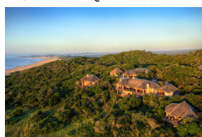
OCEANA BEACH & WILDLIFE RESERVE AFRIQUE DU SUD