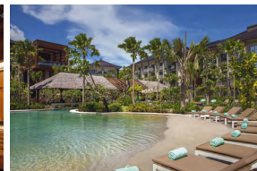
JIMBARAN BALI INDONÉSIE