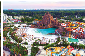
RIXOS PREMIUM DUBAI ÉMIRATS ARABES UNIS