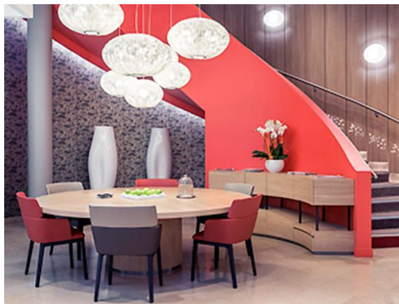
Lobby du Mercure Paris Montmartre Sacré Cœur

A son arrivée, le client est accueilli par le réceptionniste devenu « hôte », les formalités administratives étant réglées en amont. Le desk disparaît progressivement au profit d'une démarche d'accueil à la « table d'hôtes » ou dans l'un des autres lieux de vie de l'hôtel. Lorsque le client est membre du programme Le Club Accorhotels, des attentions spéciales lui sont dédiées allant du check-in prioritaire à la garantie d'avoir une chambre disponible à J-2, selon le statut.