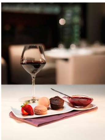
Proposition de Vin Gourmand : verre de vin rouge et ses « grignotises »

Le petit-déjeuner , un des moments les plus importants du parcours hôtelier a été revisité autour de deux fondamentaux : la qualité et l'ancrage local. En France, 80% du réseau propose désormais des produits emblématiques de la région ainsi qu'une sélection de produits issus de l'agriculture biologique et sans gluten. Un service qui s'étendra à la totalité du réseau d'ici la fin de l'année.