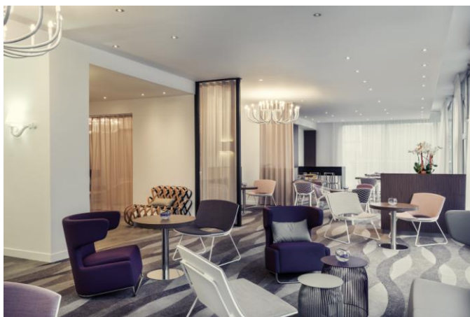
Lounge Bar du Mercure Paris Montmartre Sacré Cœur

Pour répondre aux modes de vie des travailleurs nomades, Mercure a développé « EasyWORK » , un espace de travail dédié et modulable avec des petites salles de réunion et un équipement technologique dernier cri. Présent dans 4 hôtels en Ile-de-France, l'espace peut être loué à la demi-journée au tarif de 24€ par personne. D'ici la fin de l'année, une plateforme de réservation en ligne sera proposée . D'ici 3 ans, EasyWORK sera disponible dans 30 établissements à proximité de gares, d'aéroports ou d'importants pôles économiques régionaux.