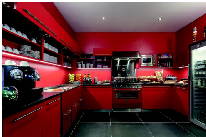
Cuisine Lounge - Mercure Lille Centre Grand Place

Les nouveaux espaces de restauration (Cuisine Lounge, Bar Lounge et restaurant Lounge) se déploient au rythme des rénovations. Le concept « Cuisine Lounge » par exemple, présent dans 3 établissements (Lille, Nice et Toulouse Wilson) sera présent dans 7 autres établissements d'ici la fin de l'année. Les clients ont rapidement adopté cet espace de cuisine ouverte qui fait la part belle aux recettes traditionnelles locales et où chacun se sert « comme à la maison ». Les espaces Bar et Restaurant Lounge , décloisonnés, deviennent de véritables lieux de vie très appréciés tant pour picorer « branché » qu'à l'occasion de déjeuners ou de dîners plus formels.