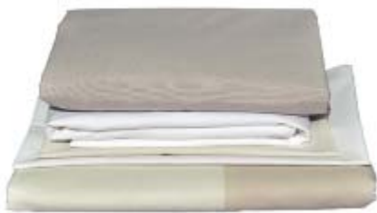
Parure de lit – de 195€ à 235€