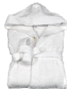
Peignoir – 50€