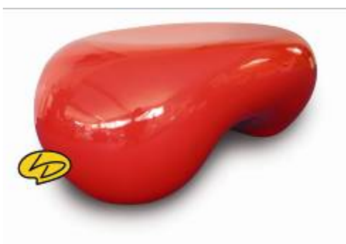
Table B.a.b.a – de 669€ à 749€