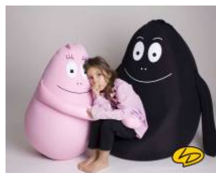
Pouf Barbapapa – 209€