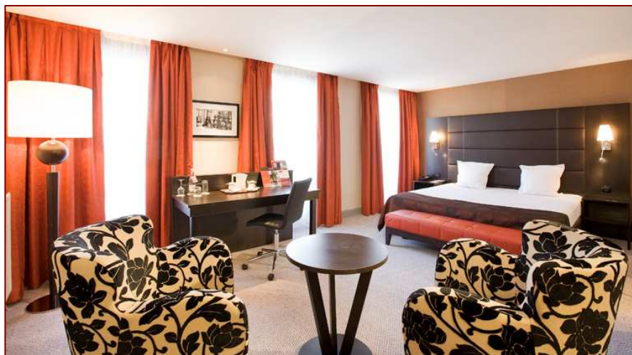
Chambre Privilège

Les 236 chambres climatisées sur six étages dont 24 chambres supérieures (chambres Privilèges) associent deux univers : masculin et féminin, pureté des lignes, chaleur des matières et rondeur des assises. Certaines offrent une vue sur le Sacré Cœur tout proche.